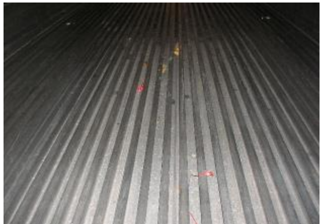
(野菜/貨物の残り)-受取拒否