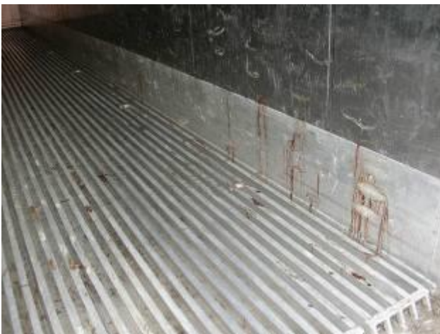
(血のり) - 受取拒否