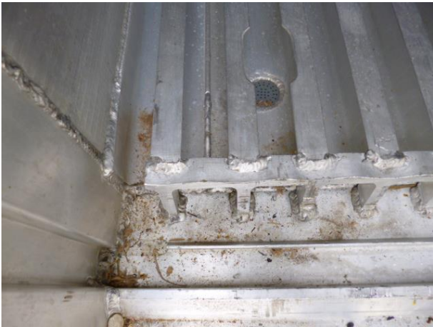
(若干のホコリ屑)-清掃不要

Tレールの隙間に輸入貨物の残留物が残っている場合、輸入貨物の残留臭のために後積貨物に臭い付きダメージが発生する恐れのある場合、氷が大量に残っている場合等は 受取をお断り致します。