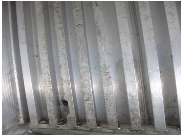
(レール上に若干の手に付く汚れあり)-清掃不要