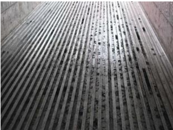
(広範囲汚れ)-受取拒否