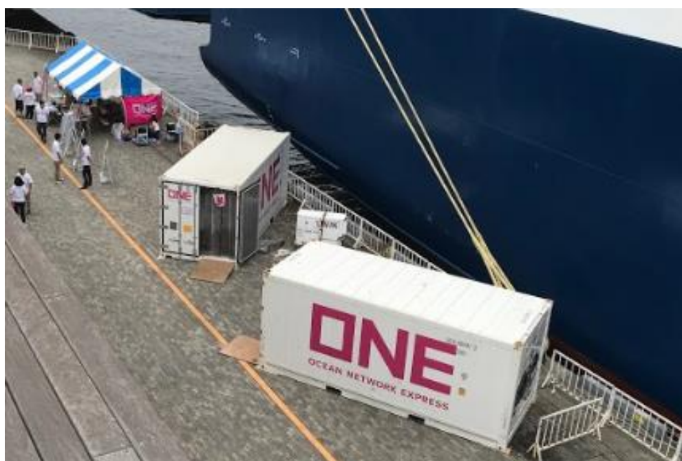
岸壁に蔵置されたリーファーコンテナ(20 フィート x2 本)

(注1) 「海洋都市横浜うみ博 2019 ～見て、触れて、感じる 海と日本 PROJECT～」海洋に関する企業・団体が設立した「海洋都市横浜うみ協議会」が、海の魅力を体感してもらうために横浜港で主催するイベント。