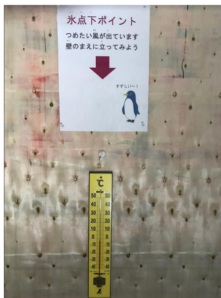
コンテナ内の様子（マイナス 5 度）