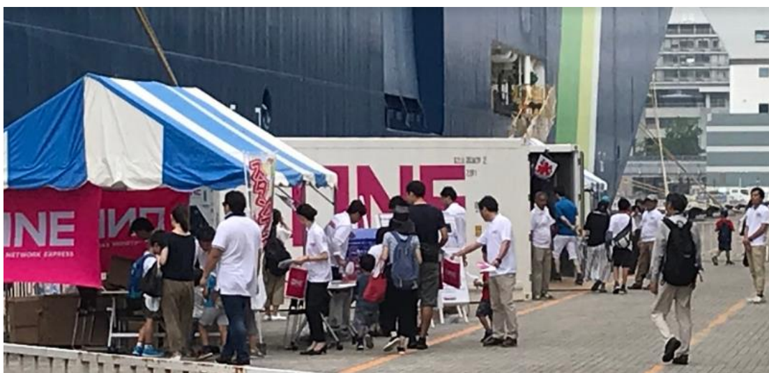
コンテナ見学会の様子②